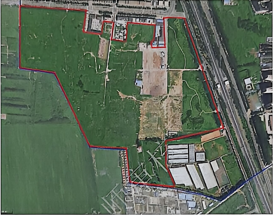
水屯市场已拆除地块范围图