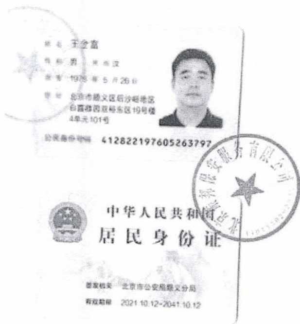
附件 2: 法人身份证复印件