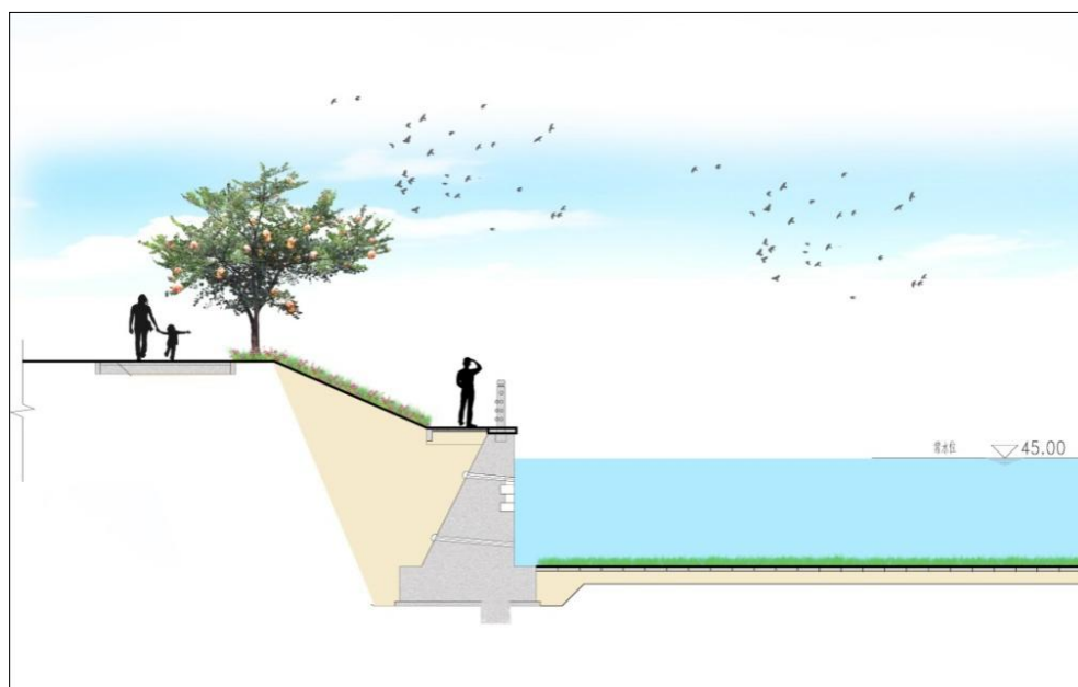
图 5-2 挡墙修复断面图 A

断面A：新建浆砌石重力式挡墙结构，挡墙外露墙高2.95~3.19m，挡墙外立面花岗岩毛料石利旧，M10水泥砂浆砌筑Mu50块石，M12.5砂浆勾平缝，墙顶宽0.6m，墙趾宽为2.9~3.0m，背坡坡比1:0.5，直墙上设置花岗岩帽石。墙后新建1.2m宽亲水步道，步道后方放坡不陡于1:2，接现状地坪高程，坡上绿化恢复。