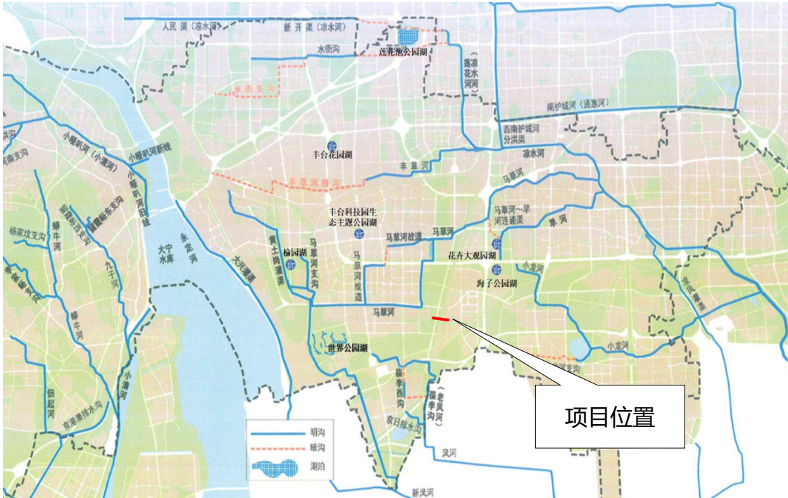
图 1-1 工程位置图

马草河挡墙修建于 2010 年前后，目前已运行 15 年以上老化严重，由于挡墙长期遭受洪水冲刷侵蚀，马草河与樊羊路交叉位置部分河道挡墙出现坍塌倾斜结构失稳的现象，为保障河道防洪安全本次设计对马草河（樊羊路两侧）挡墙进行修复长度 190m，修复段均位于河道右岸，桩号 3+610~3+700、3+753~3+843、3+961~3+971。