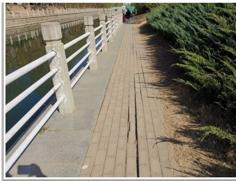
图 4-1 挡墙倾斜导致墙顶步道开裂

墙顶前后错位，与人行步道间有明显开裂缝隙，如再次发生洪水有可能导致人行步道甚至岸上巡河路坍塌威胁过往行人及车辆安全。