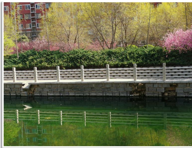
图 4-2 现状墙体坍塌