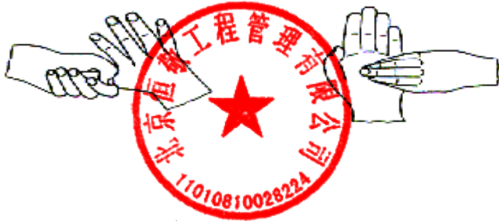
5. 拇指在掌中转动搓擦