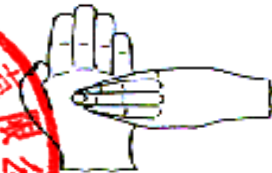
6. 指尖在掌心中搓擦