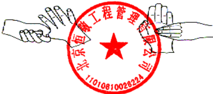
5. 拇指在掌中转动搓擦