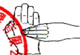
6. 指尖在掌心中搓擦