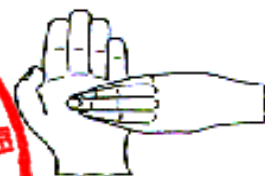
6. 指尖在掌心中搓擦