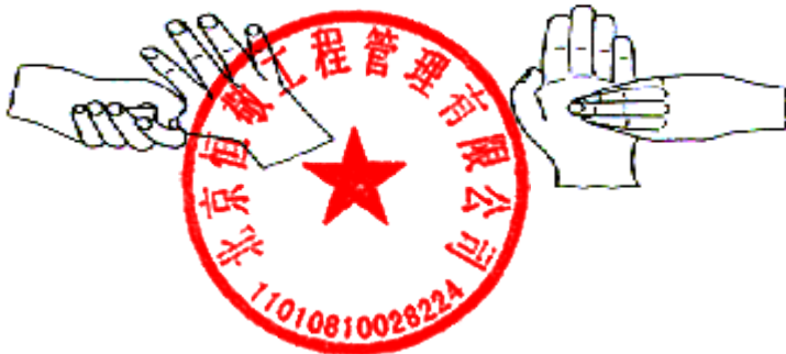
5. 拇指在掌中转动搓擦