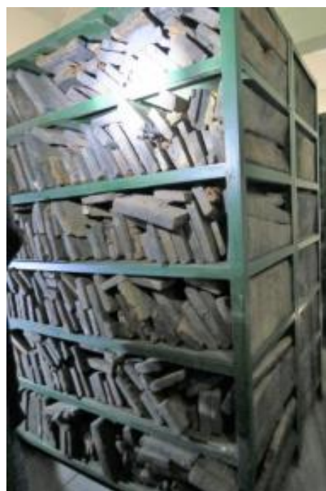
图-2. 云居寺经板存放情况

云居寺的经板，很大规模地出现不同程度的病害，包括经板木载体的病害、披麻挂灰-打底层的病害、以及前人不当修复及其使用之粘着剂老化等病害三个方面。