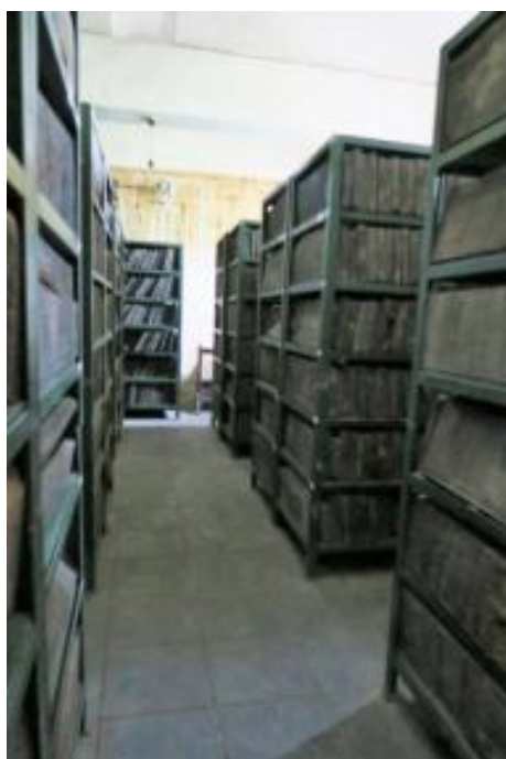
图-1. 云居寺库房情形