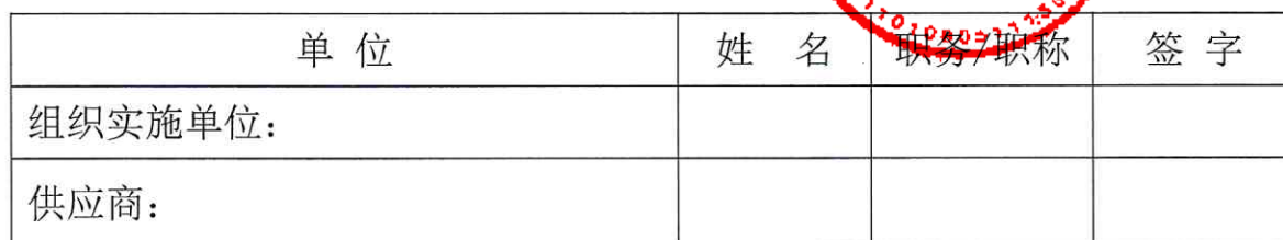
表二：水利工程日常维修保养费—北京市城市河湖管理处 XXXX年水环境维护项目合同完工验收被验单位签字表