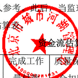
资金流估算表（参考格式）

承包人应在按第10.1款约定向监理人提交施工总进度计划的同时，按下表约定的格式，向监理人提交按月的资金流估算表。估算表应包括承包人计划可从发包人处得到的全部款额，以供发包人参考。此后，当监理人提出要求时，承包人应在监理人指定的期限内提交修订的资金流估算表。