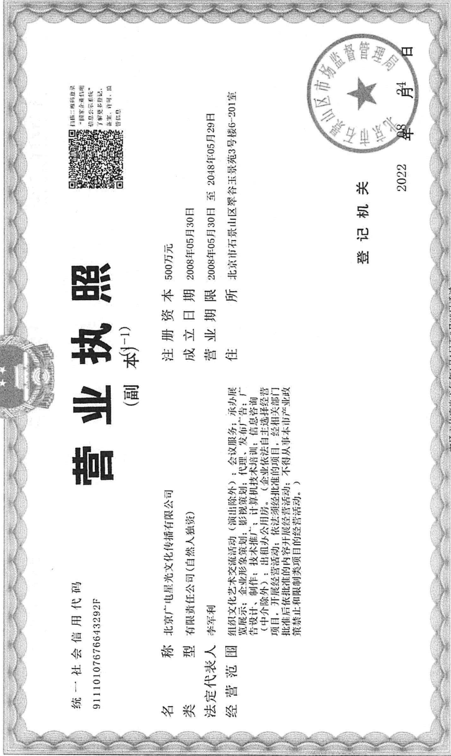
附件 1: 乙方经年检的营业执照副本复印件

市场主体应当于每年1月1日至6月30日通过国家企业信用信息公示系统报送公示年度报告。 http://www.gsxt.gov.cn 国家市场监督管理总局监制