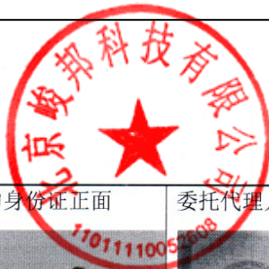
委托代理人有效期内的身份证正面