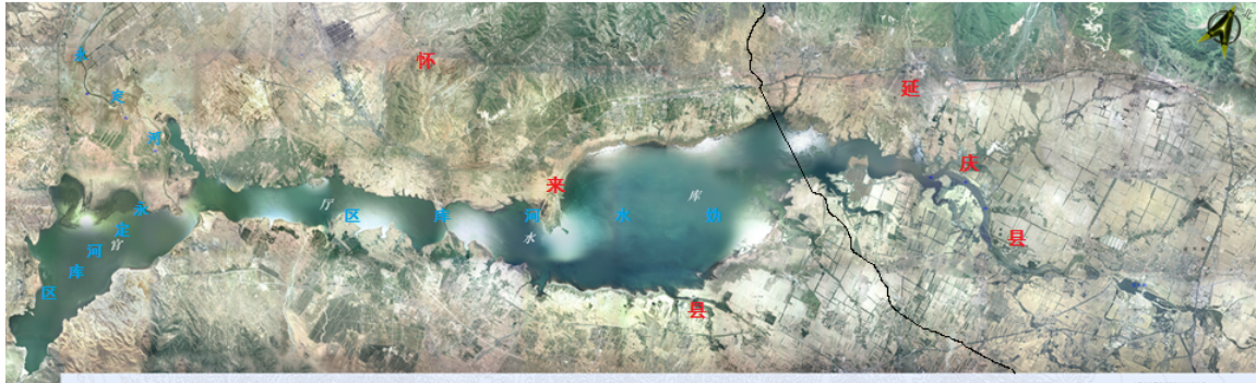
图 1-2 官厅水库库区影像图