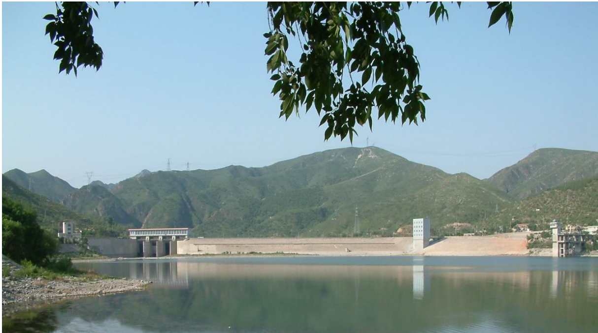
图 1-3 官厅水库枢纽工程

官厅水库为大(1)型综合利用水利枢纽, 工程等级为 I 等工程, 主要建筑由输水泄洪洞、拦河坝、溢洪道、水电站四部分组成, 均为 1 级建筑物。